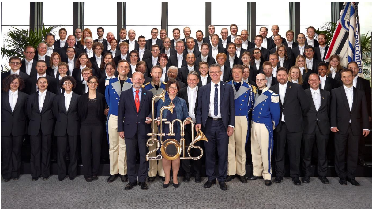
Photo de la Concordia avec les autorités à la sortie de l'auditorium Stravinski.

Cette fête a également permis aux membres de renforcer les liens amicaux dans un esprit de décontraction. Participer à une fête fédérale est définitivement un moment précieux dans la vie d'une société de musique.