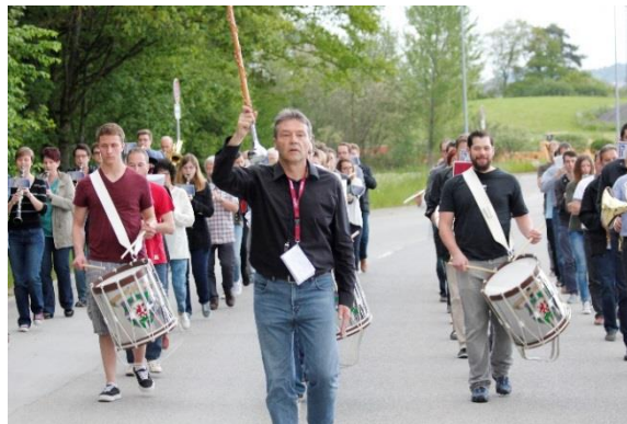
Répétition marchante devant Forum Fribourg